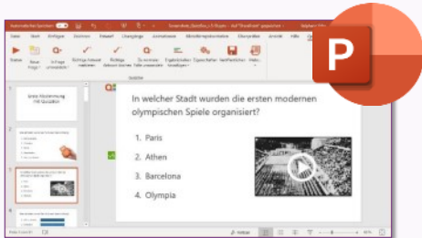
Vorbereitung der Abstimmung in PowerPoint