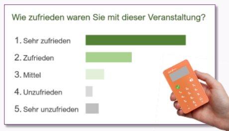
Anzeige der Ergebnisse in Echtzeit